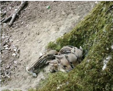
Jeunes marcassins nichés dans le creux d'un arbre, attendant leur mère. Espace Rambouillet — mai 2020