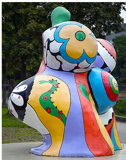
Niki de Saint-Phalle (1930-2002). - Nana. - Sculpture située à Leibnizufer Hanovre, Allemagne.

1 conférence : 10 € / 5 conférences : 40€